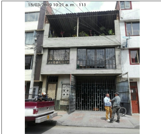
Fotografía No. 1 Fachada del establecimiento.