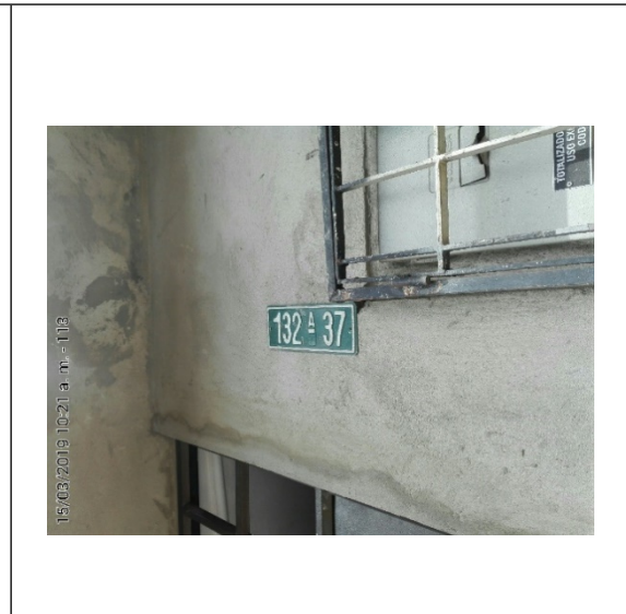
Fotografía No. 2 Nomenclatura urbana del establecimiento.