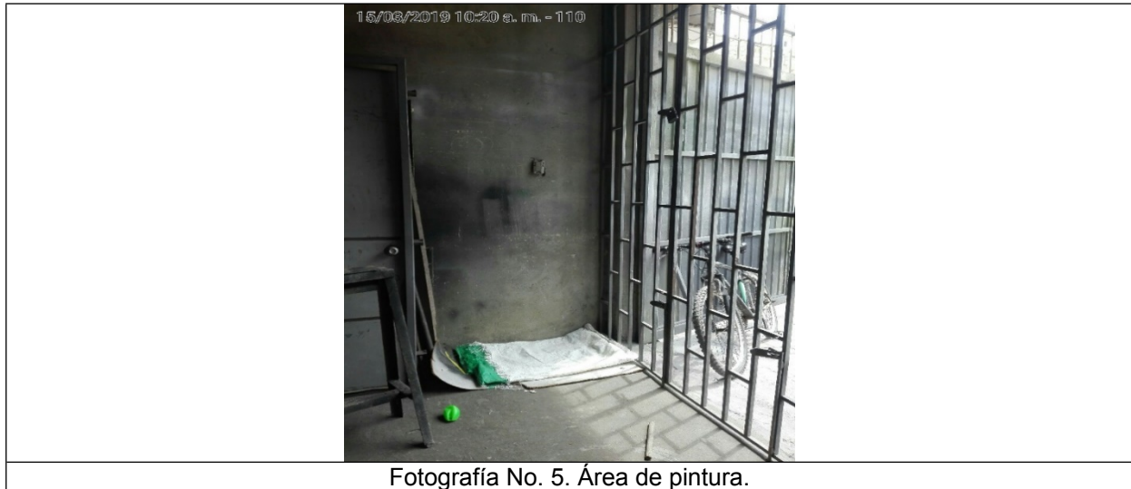
Fotografía No. 5. Área de pintura.