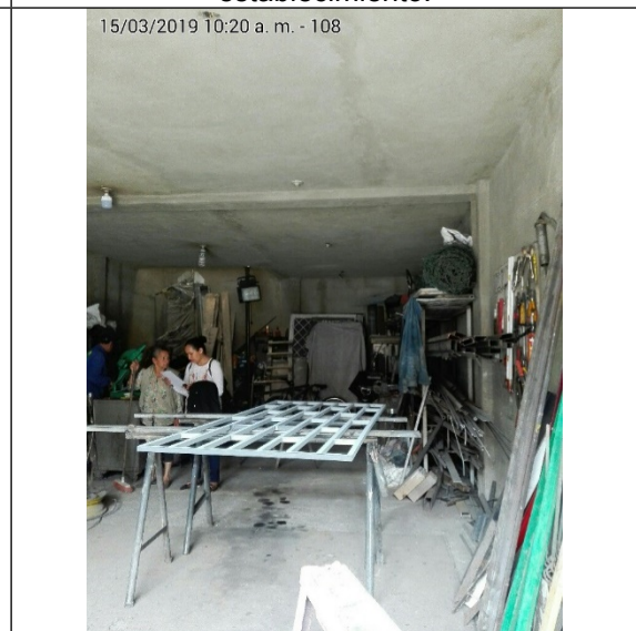
Fotografía No.4 Área de corte y ensamble.